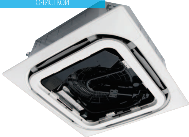
ПАНЕЛЬ С АВТОМАТИЧЕСКОЙ ОЧИСТКОЙ